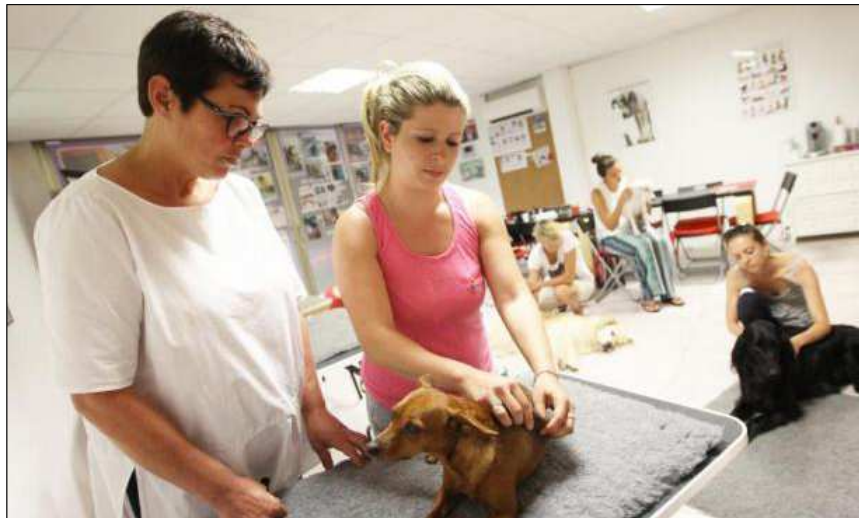
Les élèves alternent entre théorie et pratique.

Parce que, même si pour les néophytes la pratique peut prêter à sourire, elle est des plus sérieuses. Et repose sur un protocole et des consignes millimétrées. « Un geste mal fait avec une pression trop forte au mauvais endroit peut provoquer des séquelles sur l'animal », souligne la formatrice qui demeure intransigeante sur les acquis de ses aspirants : « Les gens qui sortent d'ici en font leur métier, ils doivent être irréprochables,